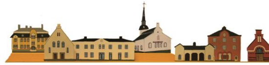
Miniaturstaden Lindesberg 1920